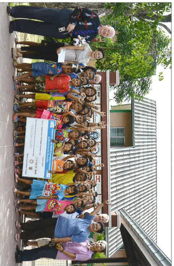
Im Child Protection und Development Center Center.