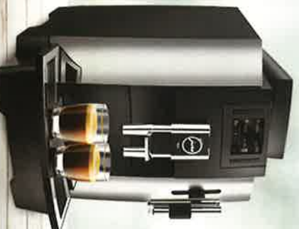
• Jura W8