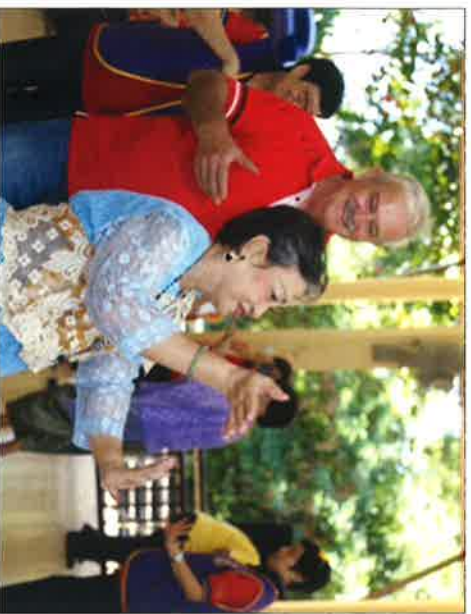
Die Leute im Altersheim Banglamung freuen sich immer wenn sie ein wenig Zuwendung bekommen.