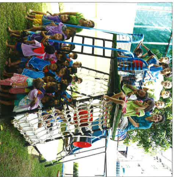
Bei der Hand to Hand Foundation.