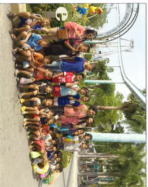
Badeausflug mit Kindern des Glory Hut Heim.