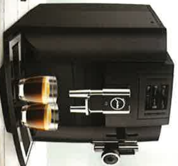
• Jura E8