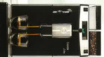
• Linka Black