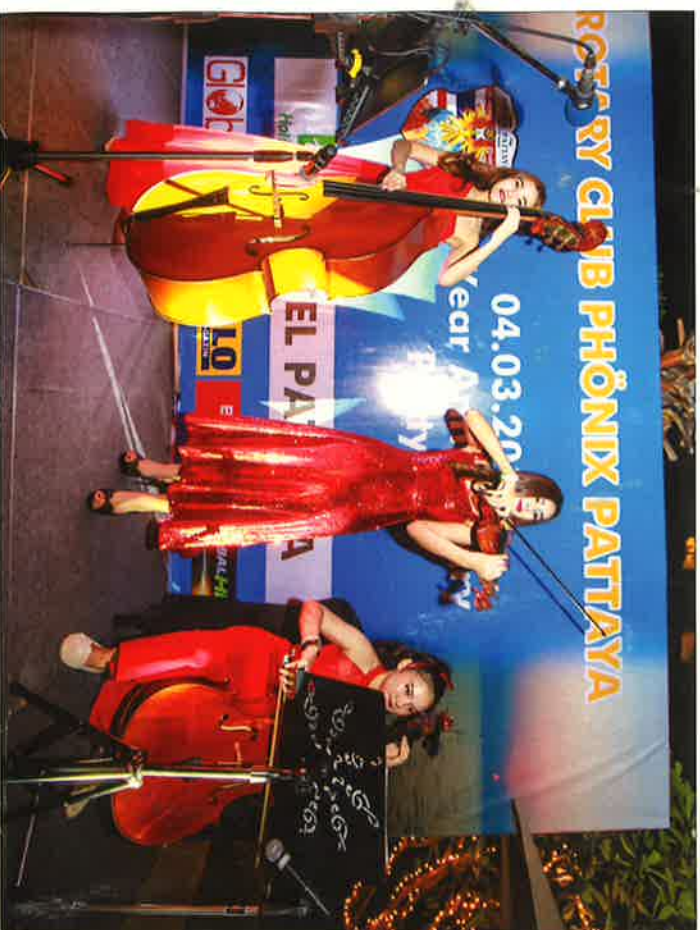
Die Princess Band.