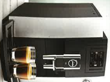
• Jura E6