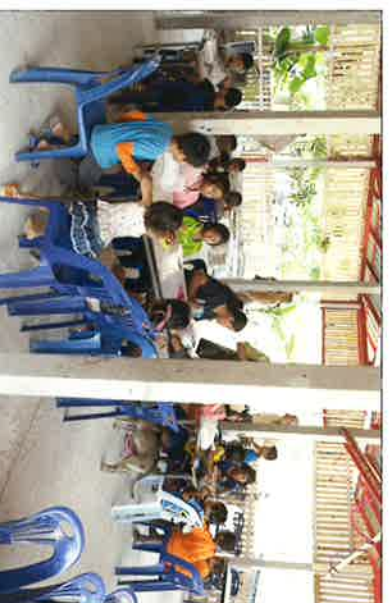
Einige Kinder im Anti Human Trafficking and Child Abuse Center.

Viele der späteren Projekte wurden in Zusammenarbeit mit dem Lions Club Phönix aus Hongkong durchgeführt, die ihre Rotarier-Namensvettern kräftig unterstützten. Weitere Projekte kamen dazu: Das „neue“ Child Protection Center (CPDC), das unter der Schirmherrschaft der „Human Help Network Foundation